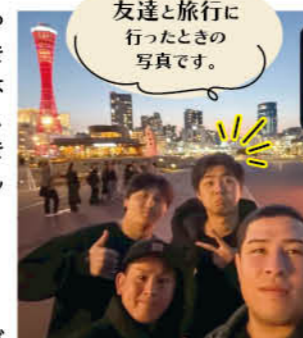
友達と旅行に行ったときの写真です。

会社の雰囲気がとても良く、社員の方々が楽しそうに働いている姿が印象的でした。ここなら自分のコミュニケーション力を活かしながら成長していけると感じ、入社を決めました。