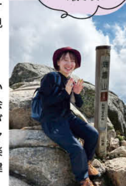
初登山、山頂での達成感いっぱい！一枚です！

「チャレンジ&バックアップ」という言葉に惹かれたことが、一番の理由です。挑戦できる機会が多いことや、安心して取り組める人や環境が整っていることを、就活イベントで社員の方々が口を揃えて話していました。また、「仕事が楽しい」という想いが表情からも伝わってきて、建工グループの一員になりたいと思いました！