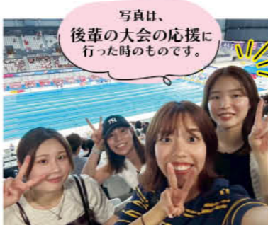
写真は、後輩の大会の応援に行った時のものです。

実際に手掛けている構造物を見て面白さを感じたことに加え、会社説明会で感じた温かい雰囲気や人の良さが印象的で、「ここで働きたい」と思い入社を決めました。