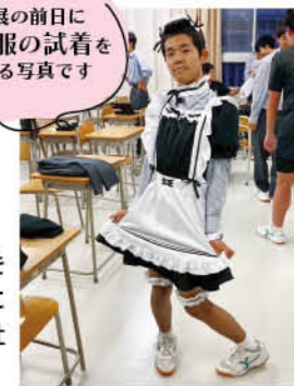
魚工展の前日にメイド服の試着をしている写真です

職人技が多い仕事だと感じ、溶接業に興味を持ちました。また、インターンシップでお世話になった北陸建工に恩返しをしたいと思い、入社を決めました。