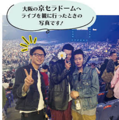
大阪の京セラドームへライブを観に行ったときの写真です！

ここでしか作れないモノづくりに携わりながら、自分自身も成長していきたいと思い、入社を決めました。