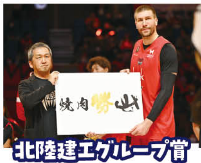
北陸建エグループ賞