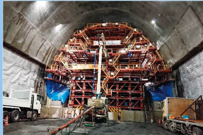
シュート部②組立センター

京都府宇治市にある天ヶ瀬ダムは1964年に築造された多目的ダムである。本工事は近年の降雨量の増加、人口増加による電力消費の増量、発電用貯留量の減少などにより能力不足が課題となっていた天ヶ瀬ダムの機能を改善・増強することが目的。放流能力を毎秒600m 3 増やすため、景観と環境に配慮して、全長617mのトンネル式放流設備を建設した。仕上がり内空が高さ約26m、幅23m (断面積約500m 2 ) という日本最大級の水路トンネルを計画した。破砕帯の幅が当初の想定より約1.5倍あり、工事計画を見直す必要に迫られたものの、鉄筋コンクリート (RC) 円柱支保工や型枠支保工を考案し、当初計画より約40%の工程短縮を実現した。