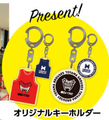
オリジナルキーホルダー