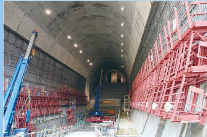
側壁用スライドフォーム